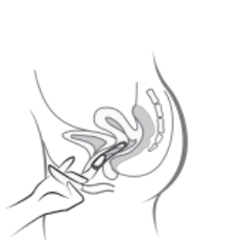
Abbildung 5 Cyclelle kann durch Einhaken des Zeigefingers oder Fassen mit dem Zeige- und Mittelfinger aus der Scheide entfernt werden.

Führen Sie den Ring mit einer Hand in die Scheide ein (Abbildung 4A); falls notwendig, können die Schamlippen mit der anderen Hand gespreizt werden. Schieben Sie den Ring in die Scheide, bis er sich angenehm eingepasst anfühlt (Abbildung 4B). Lassen Sie den Ring 3 Wochen lang in dieser Position (Abbildung 4C).