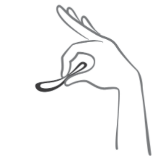
Abbildung 2 Drücken Sie den Ring zusammen