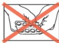
Abbildung 2: Lösen Sie einen einzelnen Blister mit einer Tablette darin durch vorsichtiges Reißen entlang der Perforation aus dem Blister-Streifen.

Abbildung 1: Drücken Sie Ihre Tablette nicht durch die Folie, da die Tablette dadurch beschädigt werden kann.